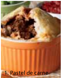
1. Pastel de carne

Otros platos comunes en la dieta de los australianos son los cocinados con carnes de animales exóticos como el cocodrilo, el canguro o el búfalo. También son importantes los crustáceos conocidos como mud crabs y las gambas yabbies.