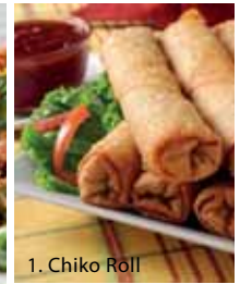
1. Chiko Roll